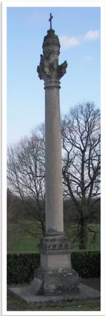
La Croix du pape, aujourd'hui

Extraits : " Les Passages du Pape Pie VII dans la Nièvre. 1804-1812 " Par L'Abbé J-M. Meunier. De la société de Linguistique de Paris Ancien élève de L'école pratique des Hautes Etudes Licencié ès lettres Professeur à l'Institution Saint-Cyr de Nevers