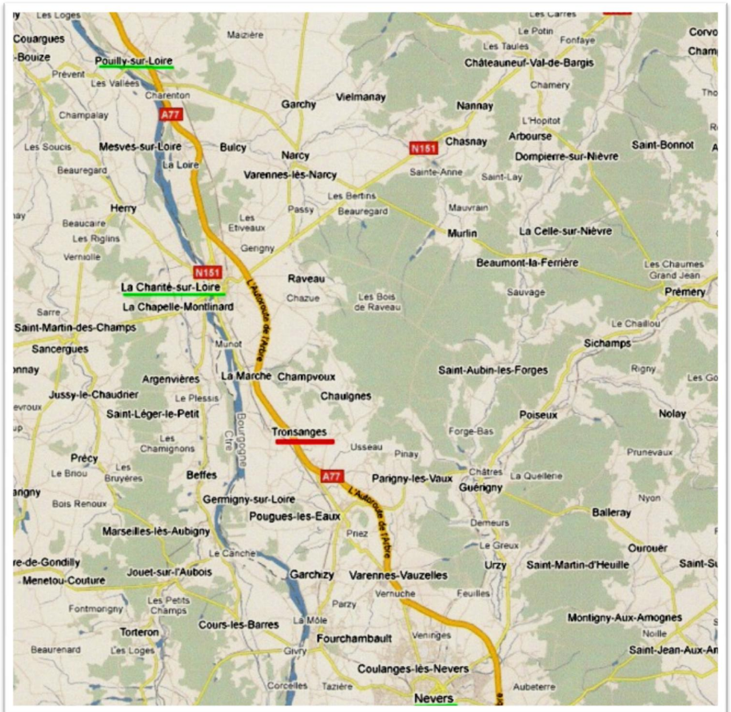
Carte de localisation de Tronsanges